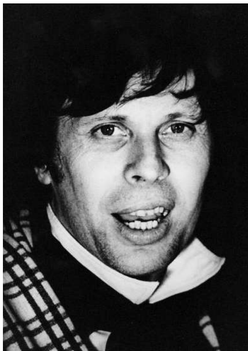
«Баня» В. Маяковского Режиссер – В. А. Персиков Поэт Чудаков – арт. Б. П. Михня