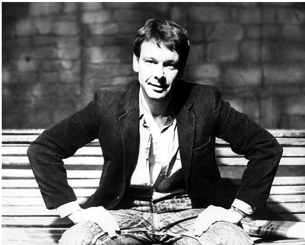
«Скамейка» А. Гельмана Режиссер – А. А. Сафронов Он – А. А. Сафронов